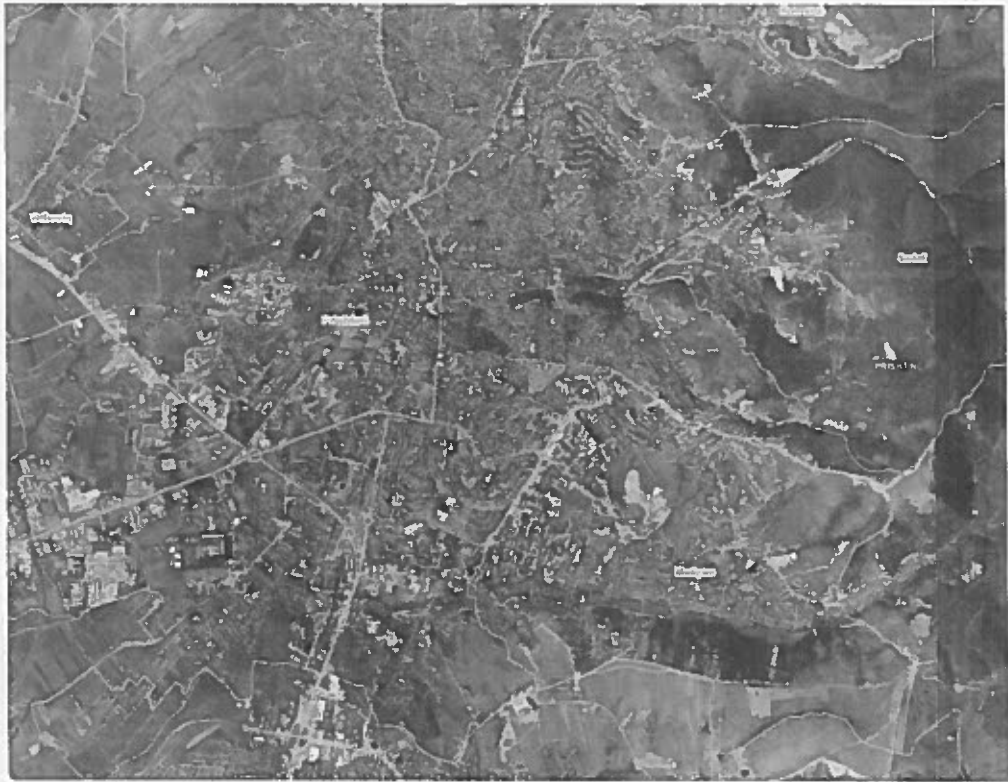
2. Kufiri i planit aktual "Lakërishta".