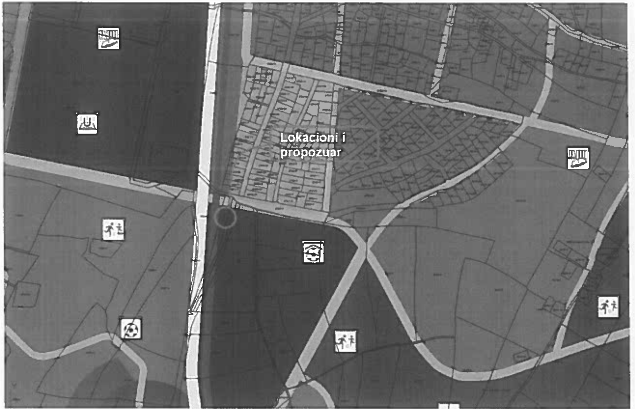
Lokacioni i propozuar sipas Planit Zhvillimor Urban