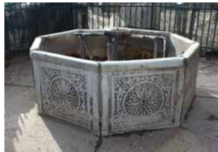
Shatërvani i qytetit daton nga shekulli XV.

Shatërvani i qytetit gjendet në kompleksin e Prishtinës së vjetër, konkretisht në oborrin e Xhamisë së Çarshisë. Ky shatërvan i dekoruar nga mermeri paraqet objektin e vetëm publik të llojit të këtillë në Prishtinë që ka mbijetuar deri më sot. Në bazë të llojit të ndërtimit dhe dekorimit prej mermeri, mund të thuhet se shatërvani është ndërtuar në fund të shekullit XVII ose fillim të shekullit XVIII. Zakonet kanë kushtëzuar që arkitektura islame të ndërtonte shatërvanë në qendër të hapësirave publike, afër ndërte-