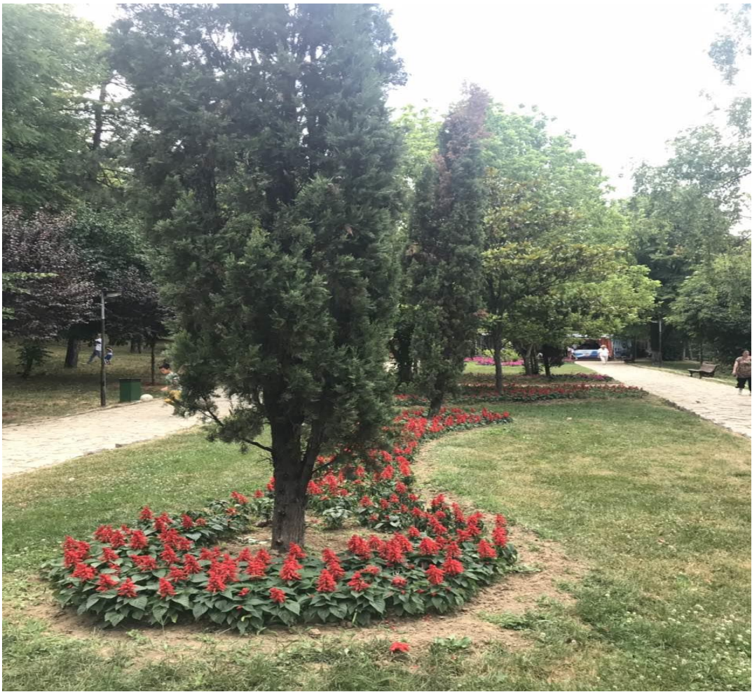
Mirëmbajtja e parqeve të qytetit nga NPK "Hortikultura";