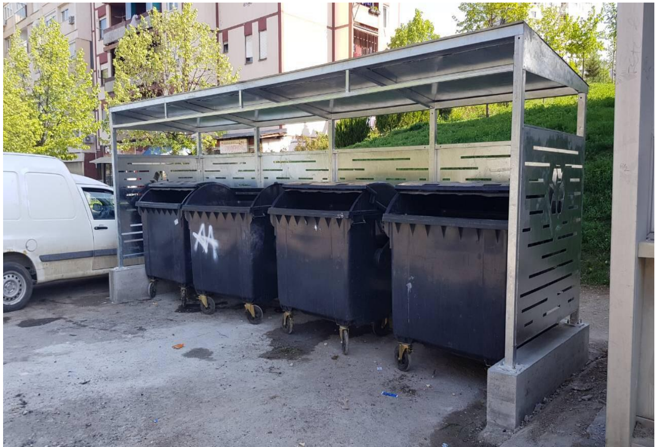
Mirëmbajtja dhe pastrimi i mbeturinave në qytet dhe hapësira publike;