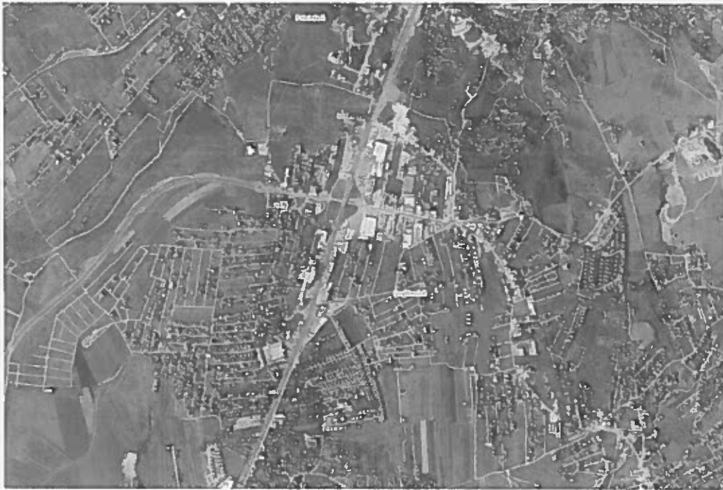
2. Granica trenutnog plana Priština e Re-Zona Perendim;