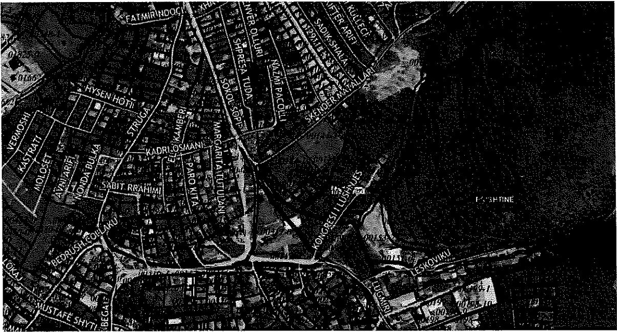
Fig. 1: Lokacioni i parcelës në Geoportal