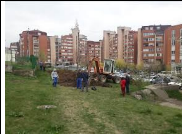
Disa foto gjat punimeve te “Kodra Diellit II