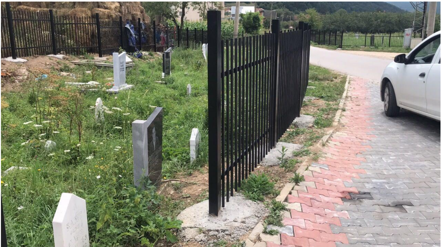
Mirëmbajtja dhe rrethimi i varrezave;