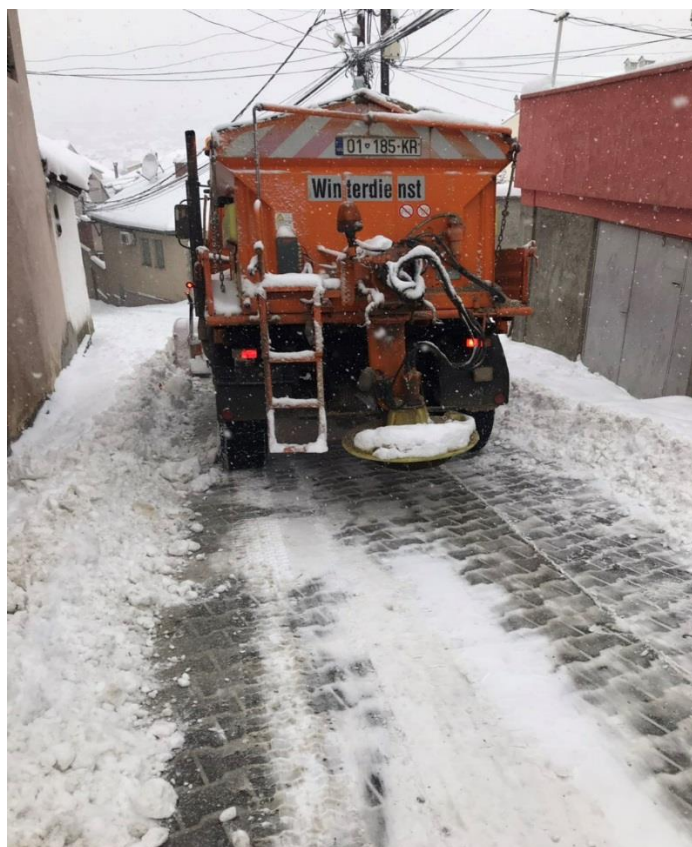
Mirëmbajtja e rrugëve dhe trotuareve në qytet nga bora;