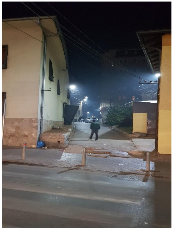
Mirëmbajtja, zgjerimi dhe modernizimi i ndriçimit publik në Prishtinë