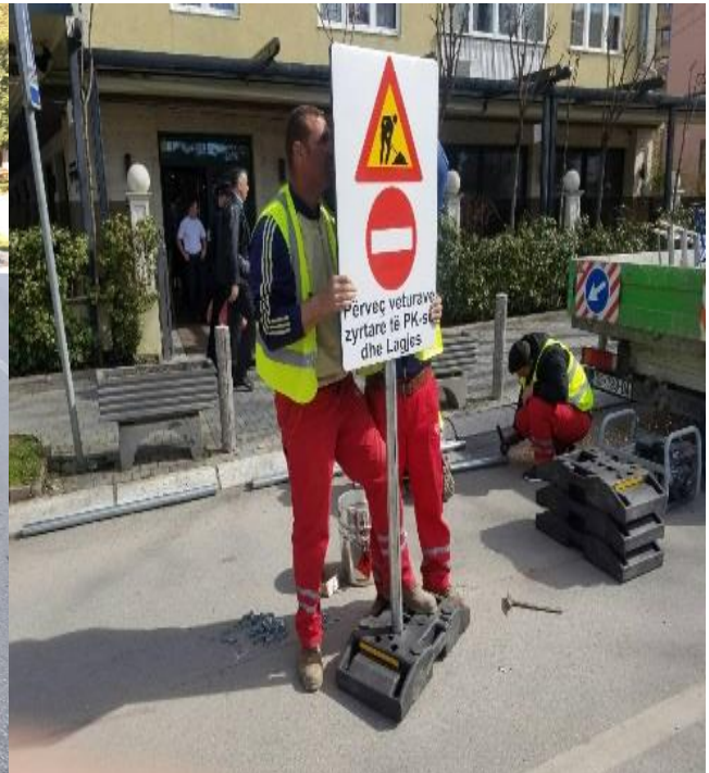
Furnizimi dhe vendosja e shtyllave antiparking për lirin e hapësirave publike, rregullimi dhe mirëmbajtja e shenjave të komunikacionit;