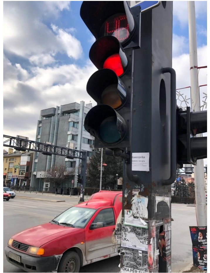
Mirëmbajtja e semaforëve;