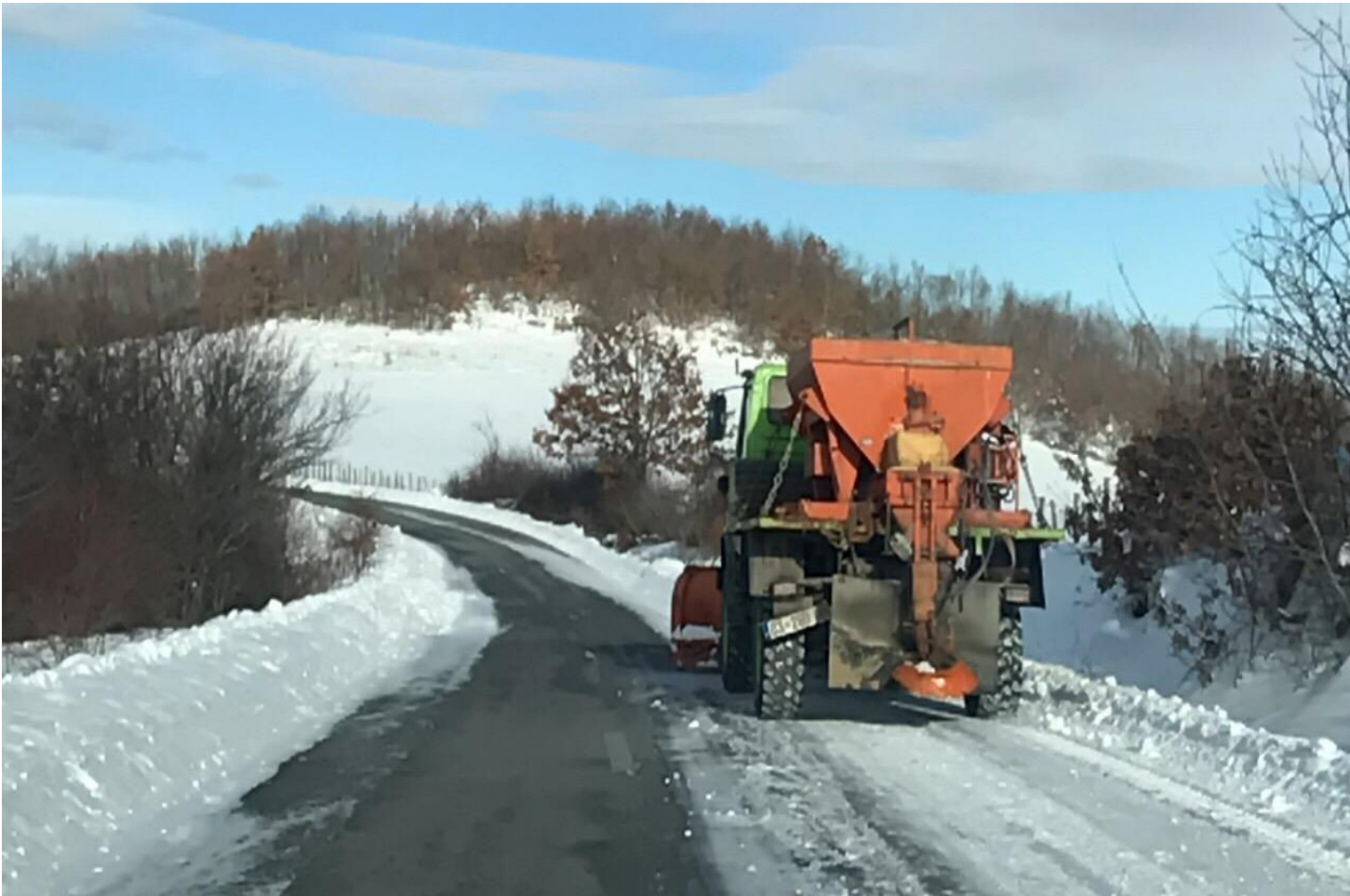
Pastrimi dhe mirëmbajtja e rrugëve rurale nga bora