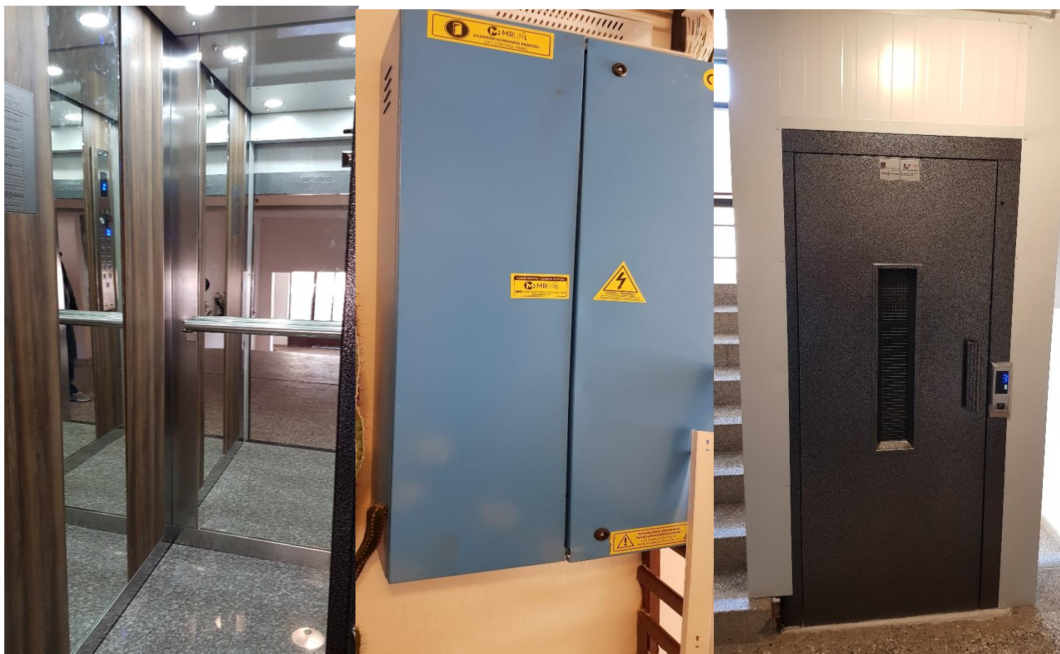
Rregullimi dhe mirëmbajtja e ashensorëve;