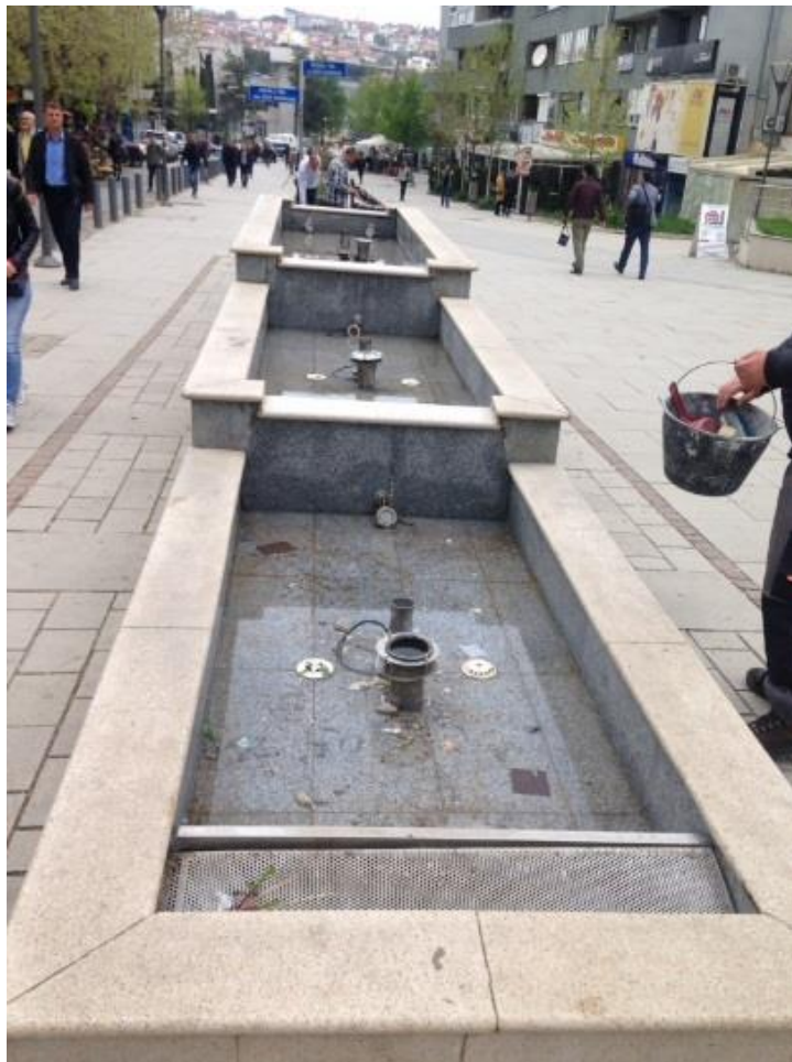
Mirëmbajtja e fontanave dhe krojeve.