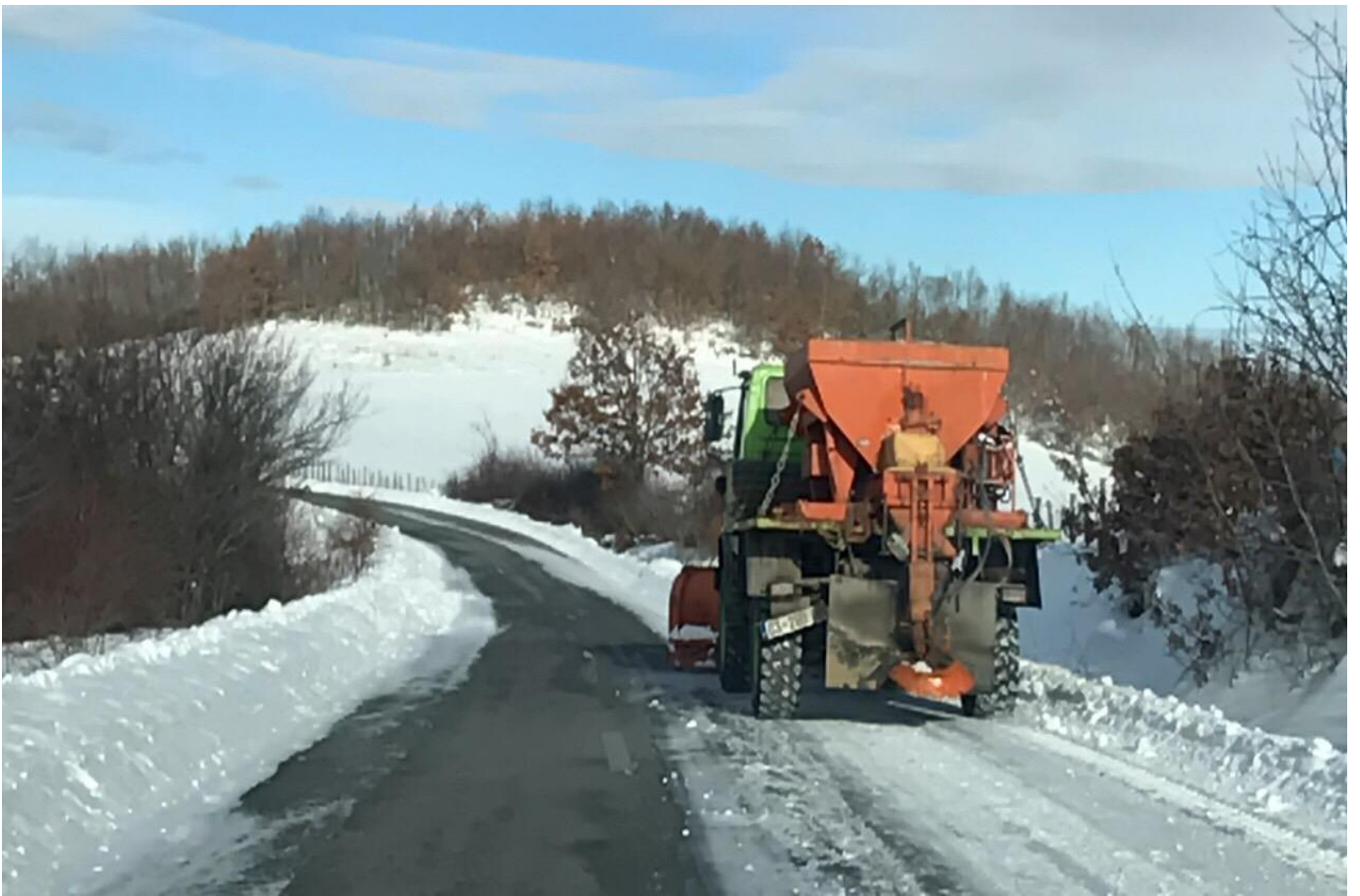
Pastrimi dhe mirëmbajtja e rrugëve rurale nga bora.