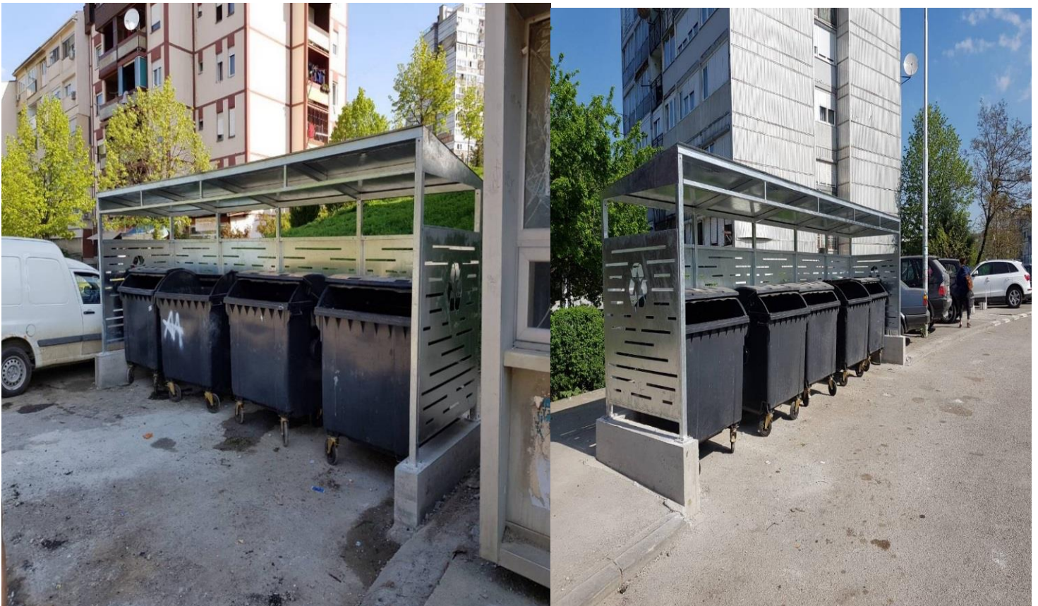
Mirëmbajtja dhe pastrimi i mbeturinave në qytet dhe hapësira publike.