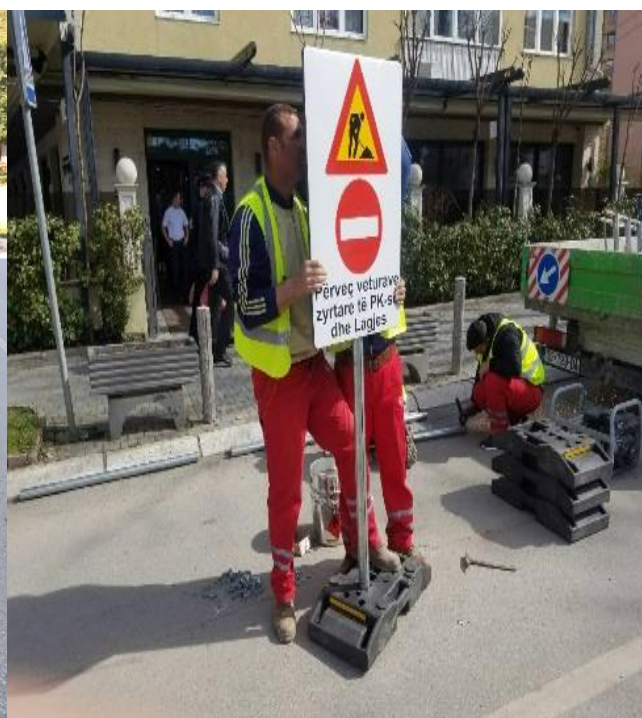
Furnizimi dhe vendosja e shtyllave antiparking për lirim të hapësirave publike, rregullimi dhe mirëmbajtja e shenjave të komunikacionit.