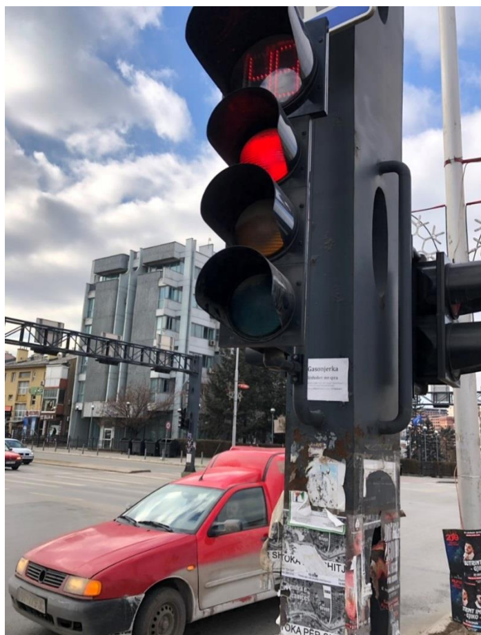
Mirëmbajtja e semaforëve.