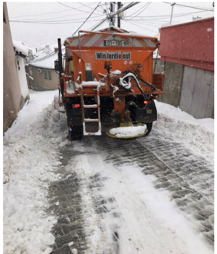
Mirëmbajtja e rrugëve dhe trotuareve në qytet nga bora.