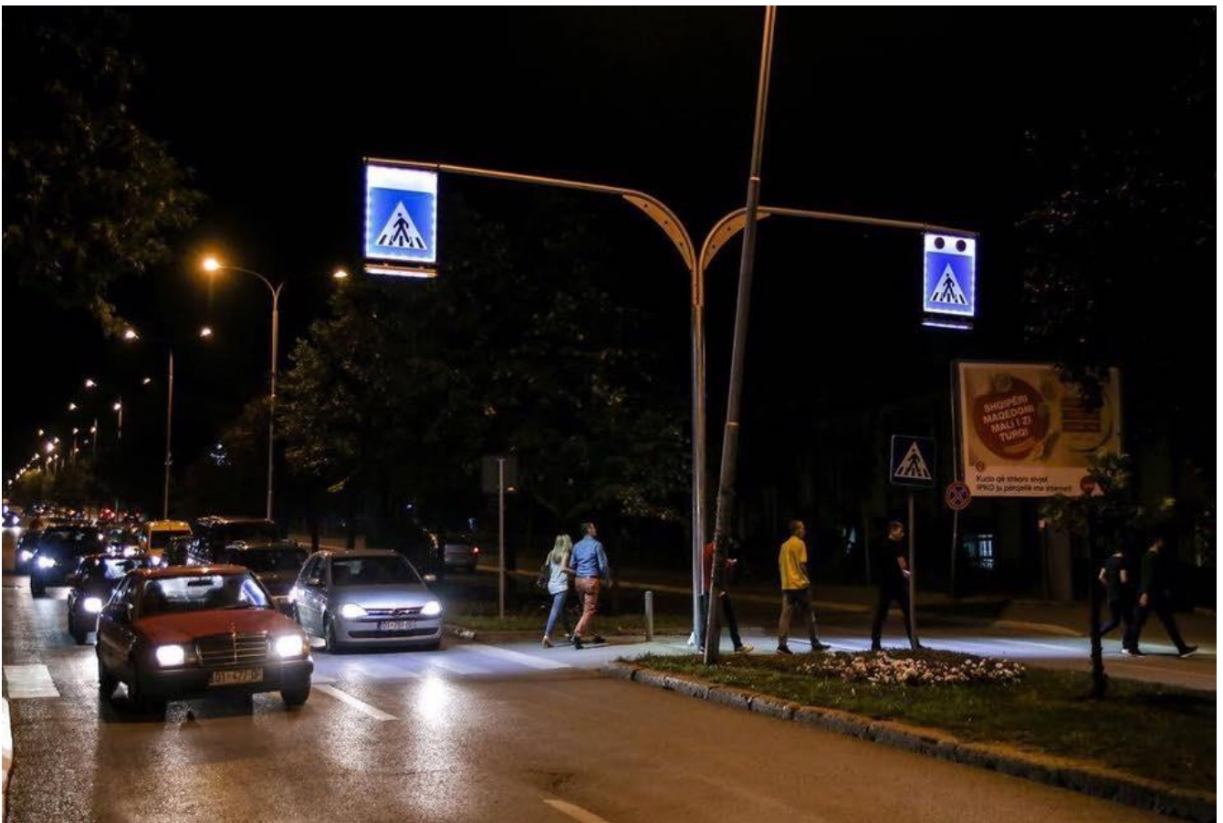
Mirëmbajtja, zgjerimi dhe modernizimi i ndriçimit publik në Prishtinë.