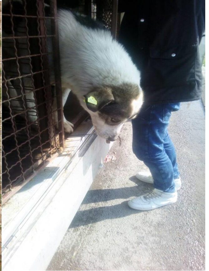
Trajtimi i qenve endacakë në komunën e Prishtinës.