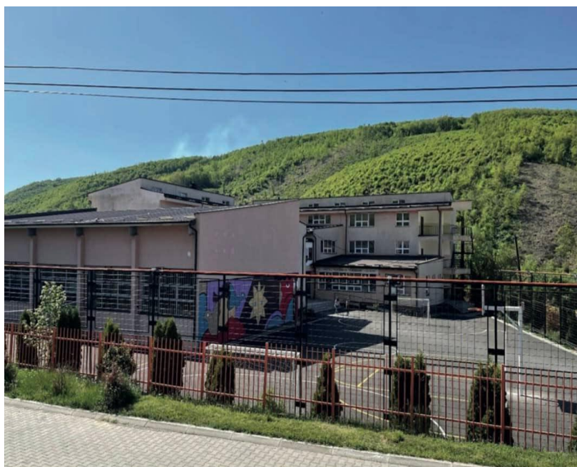
Cikli i planifikimit Shkollë – Komunë – Niveli Kombëtar:

Grafiku më poshtë tregon se si kalendari i planifikimit për Planin e Zhvillimit të Arsimit në Komunë lidhet me kalendarin e veprimeve në nivel të shkollave dhe atë kombëtar, dhe si të gjitha janë të lidhura me ciklin e buxhetit.