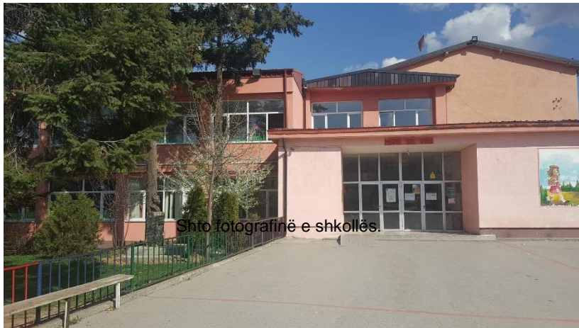
Shto fotografinë e shkollës.