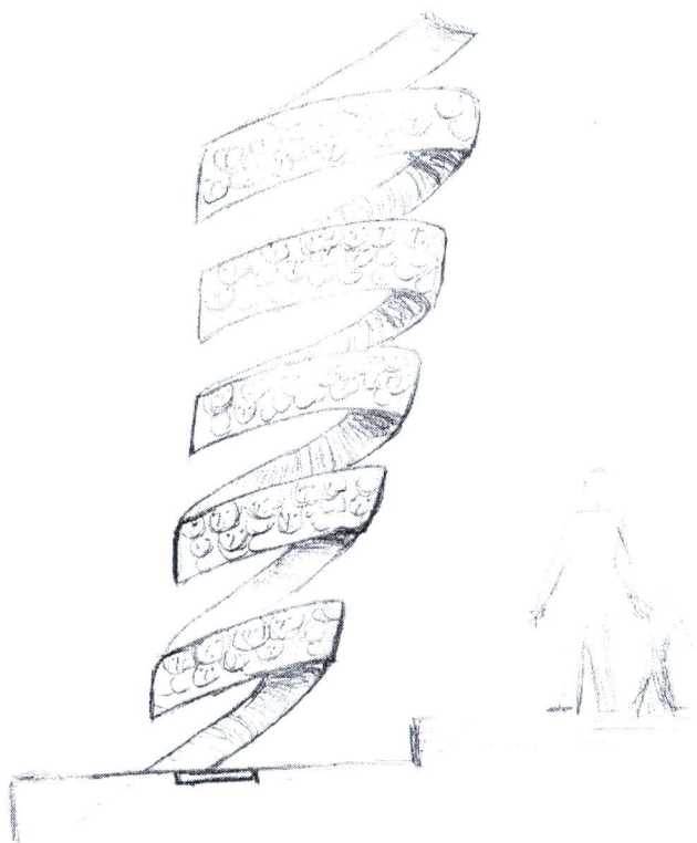
Predlog-ideje za izgled spomenika AA