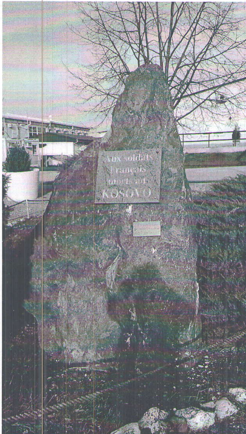
Lapidari i propozuar (Zhvendosja e tij nga Kampi ushtarak Maxhunaj në Prishtinë)