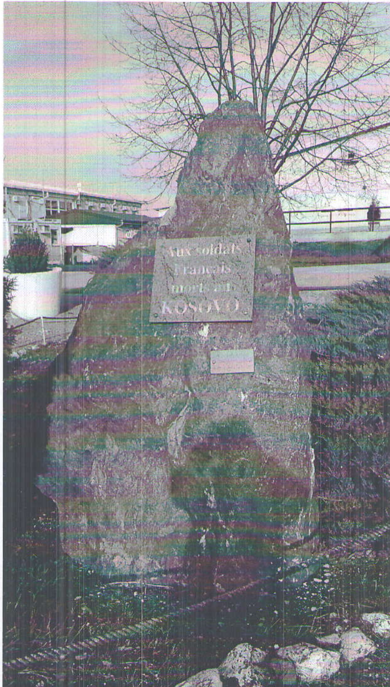
Predložen Lapidarijum (Njegovo prenošenje sa Vojnog Kampa Maxhunaj, u Prištini)