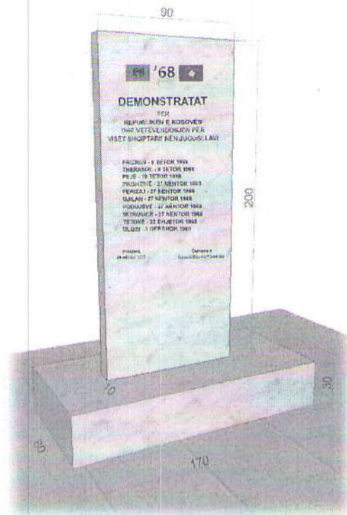
Obelisku i propozuar ( foto ilustruese );