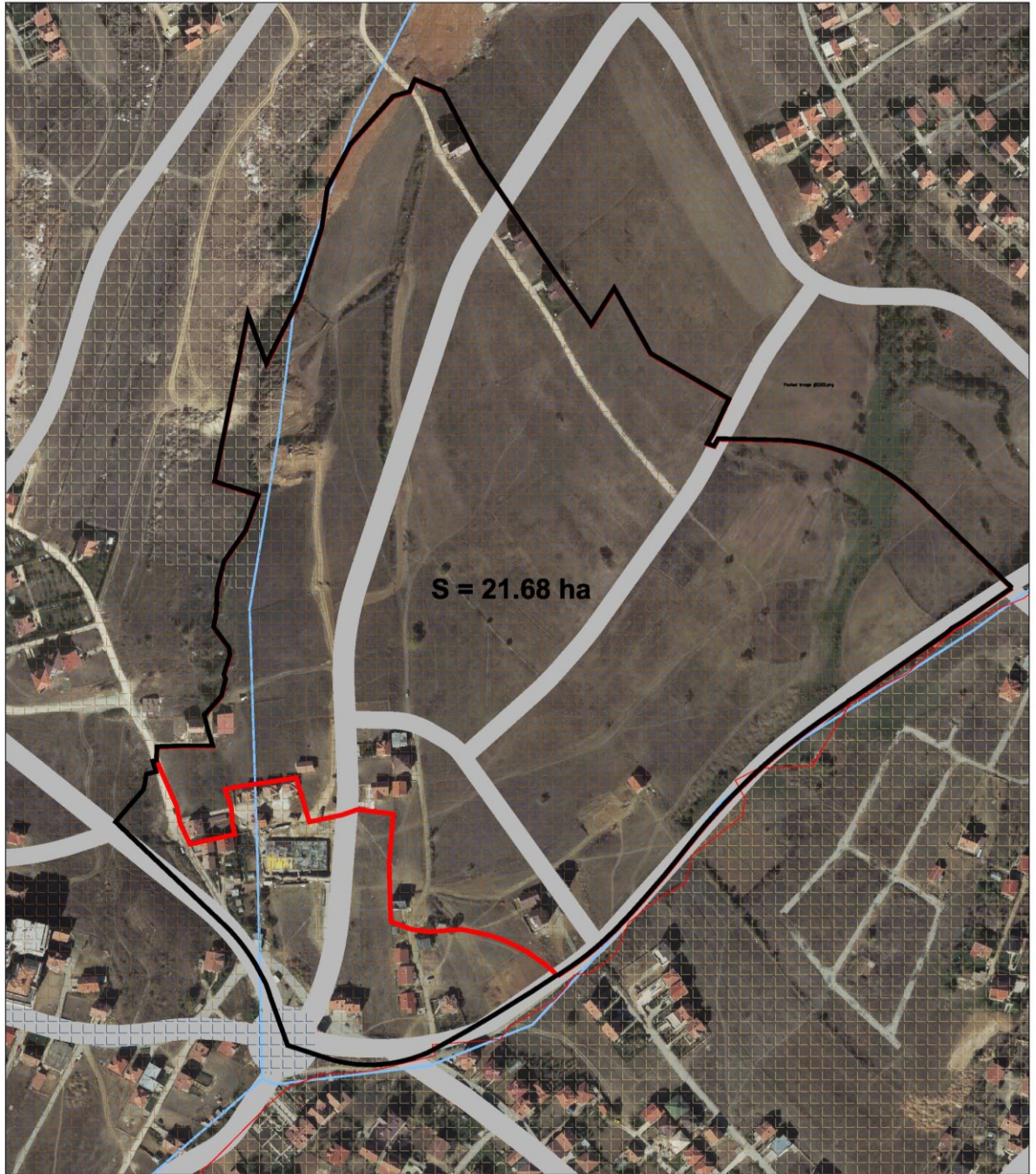
Gjendja faktike: Sipërfaqja e trajtuar, kufijtë e zonës